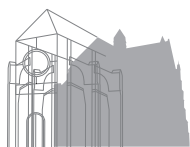
Journées du Patrimoine 2012